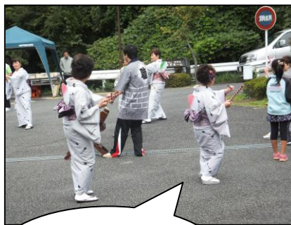
和太鼓に合わせて踊りましょう!! (ミニ盆踊り)

午前の部では、「輪投げ」や「くじ引き」、「ヨーヨー釣り」などのゲーム大会を行いました。