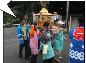
最後は皆でワッショイ!! (ミニ神輿)