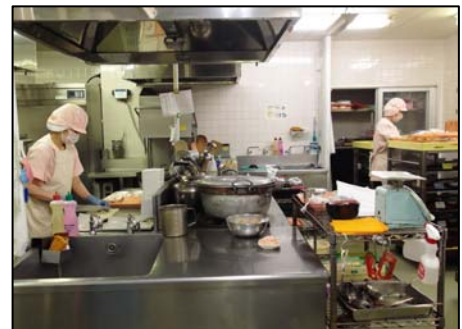
▲調理や洗浄を手分けして行います