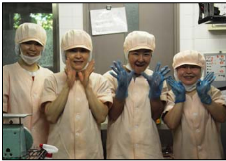
▲厨房の職員さん、良い笑顔です!!

早いもので、今年も残り1か月となりました。年の瀬になると、交通事故が増えるという統計があります。1年を通して最も交通事故が多いのが12月で、少ない月の1.5倍程多いそうです。年末の慌しさから、つい注意を怠り、事故に…ということのないように、日頃から気持ちに余裕を持って過ごしましょう。