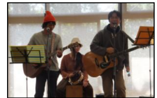
▲地域の方々との交流も