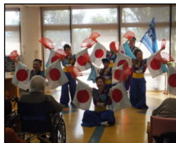
▲圧巻の踊りで会場は一体に