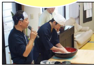
▲職人さんは話術も抜群

今回の手作り工房では、「香りの贈り物」を作りました。これは、石けんを布で包み、飾り付けをしたものです。タンスの中に入れて、ドアノブに掛けて、石けんの香りを楽しみます。皆さん、上手に出来ました。