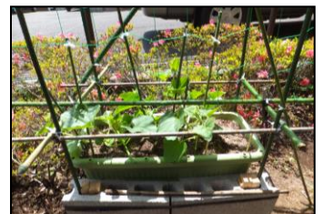
▲日光を浴びて生長中

昨年は、センター玄関横スペースに植えたヒマワリを見事に咲かすことが出来、皆さんに大変喜んでいただきました。