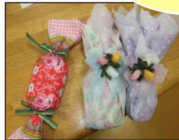
▲石けんから優しい香りが