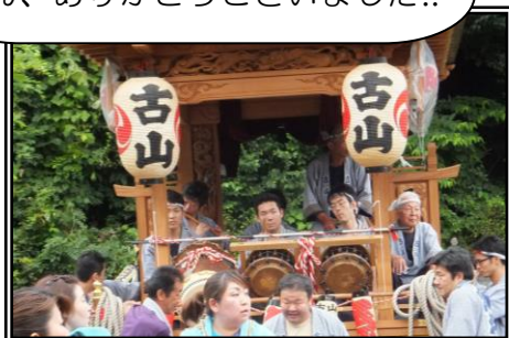
▲太鼓の音が気分を盛り上げます

7月20日(日)は毎年恒例の十二天神社祭典。ショートステイの皆さんにおみこしや山車を見てもらいました。古山自治会の皆さん、ありがとうございました!!