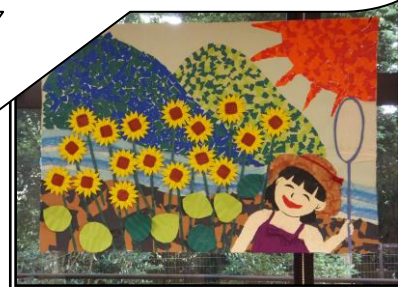
▲デイサービスフロアーに夏が

今回の壁面は、ヒマワリと笑顔の女の子が印象的な、何とも夏らしい作品に仕上がりました。デイサービスの皆さんと一緒に作りました。