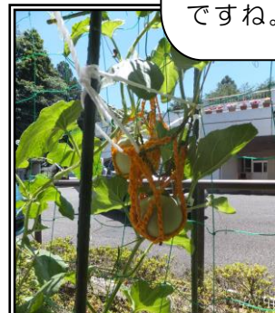
▲あまーく出来るかな?