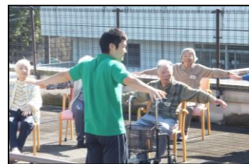
▲青空の下で体操しましょう