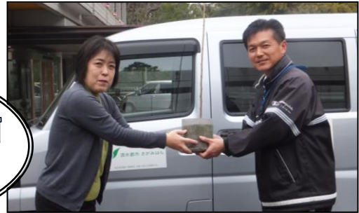
▲吉川ホーム施設長(左)が受け取りました