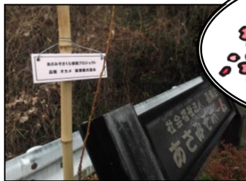
▲満開の桜を咲かせますように

3月3日(火)に相模原市社会福祉協議会を通じて、麻溝観光協会より、桜の苗木を4本いただきました。それぞれ、センターの敷地内に植樹しましたので、是非ご覧ください。いつか、ご利用の皆さんと満開の桜を見られるように、大切に育てていきたいと思っております!!