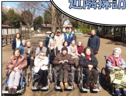
▲さあ、記念写真を撮りますよー!!