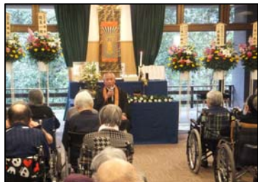
▲本弘寺のご住職による法話