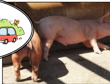
▲とても愛らしいブタもいました

3月13日(金)にデイサービスご利用の皆さんと、野外でのリハビリを目的に、相模原麻溝公園のふれあい動物広場に行ってきました。春風を感じながら、動物達とふれあうことで、心身共にリフレッシュが出来たのではないで