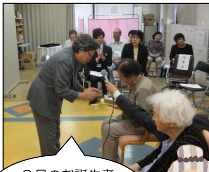
9月のお誕生者にも記念品の贈呈です