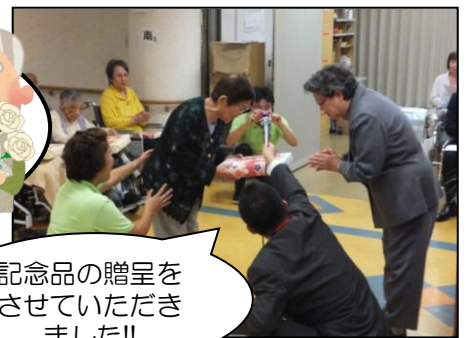
記念品の贈呈をさせていただきました!!