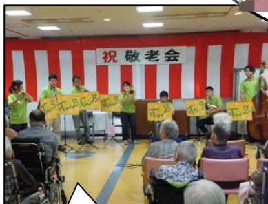
素敵な演奏に皆さん大満足の様子でした!!

第2部では、9月の誕生者4名のお祝いをさせていただきました。アトラクションに「多摩ウインドブラス」の皆さんにお越し