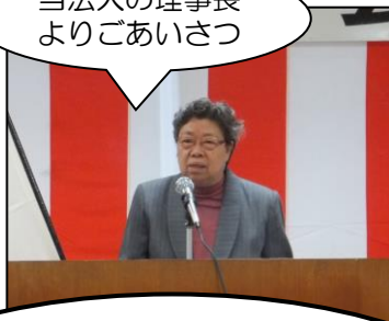
当法人の理事長よりごあいさつ

今年度も当センターを会場に、「あさみぞホーム」と合同の敬老祝賀会を実施させていただき、第1部の式典では、長寿（100歳以上）2名、卒寿4名、米寿4名、喜寿4名の皆さんのお祝いをさせていただきました!!