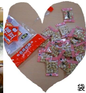
袋入りの豆を使用