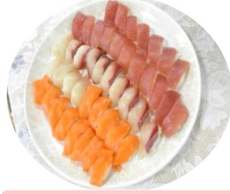
職人が握ったお寿司

握りずしのイベント食を行いました。デイケアセンターの食堂にて職人による、握りパフォーマンスの見学も行いました。普段の食事ではなかなか召し上がる機会がない為どの利用者様も美味しい～と言いながら食事されていました。 管理栄養士