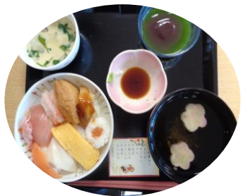
常食・一口大の方